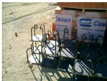
Acopio materiales (I)