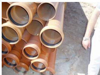
Acopio materiales (II)

Los materiales se acopian en área resistente