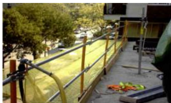
Barrera borde forjado